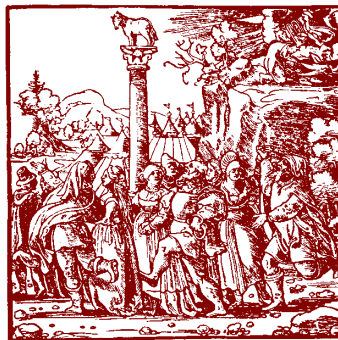
Du skall inte ha några andra gudar vid sidan av mig.

Om Israels folk hade börjat dyrka andra gudar, hade det varit samma sak som att de hade förkastat den sanne och levande Guden. När Gud sade till dem: Ni skall inte ha några andra gudar vid sidan av mig, var det ett uttryck för stor omsorg och