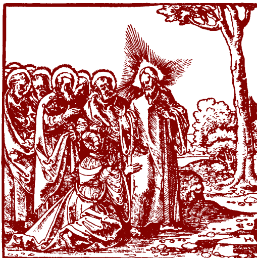
När ni ber skall ni säga: Fader vår, helgat varde ditt namn...

Fortsättning följer med Tron i mitt liv och Bönen i mitt liv.