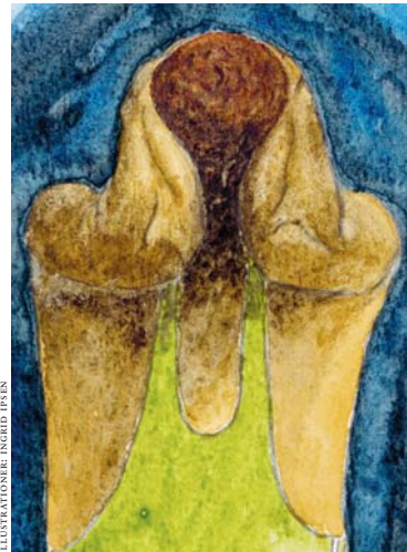
ILLUSTRATIONER: INGRIID PSEN

Avsnittet förtydligar vad Paulus redan tidigare summariskt undervisat om: lagen ger insikt om synd och skuld inför Gud (Rom. 3:19–20). Redogörelsen är personligt präglad, självupplevd. Paulus har varit slav under lagen innan han kom till insikt om frälsningen i Jesus Kristus. En brottningskamp har försiggått i hans själsliv. Lagens krav har gjort honom förvirrad och förtvivlad. Han hoppades att lagen skulle vara hans 'vän', men i stället blev den en grym 'ovän'. Budordet borde rimligtvis ha fört till liv, men i verkligheten blev det till död (v. 10). Därför är det inte överraskande att aposteln brottas med frågan: Är lagen synd?